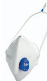
Dräger X-plore® 1720+ V