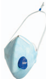
Dräger X-plore® 1710+